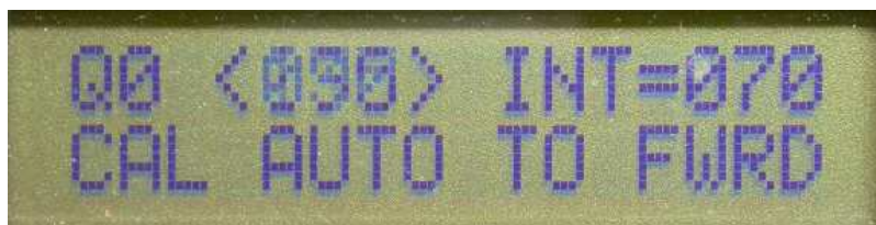
Figure 3 : Menu 4 pour caler le zéro dans l’axe du véhicule

Ce menu permet de faire le zéro angulaire du Doppler vers l’avant. Si l’antenne est sur le toit d’un véhicule, en plaçant une balise dans l’axe du véhicule, par appui sur le BP on cale le zéro du Doppler dans l’axe du véhicule. On obtient <000> pour la direction initiale.