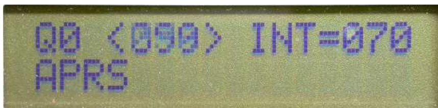
Figure 2 : Menu 1 avec transmission APRS

I Q0 <090> INT=100 I I APRS ████████████████████ I