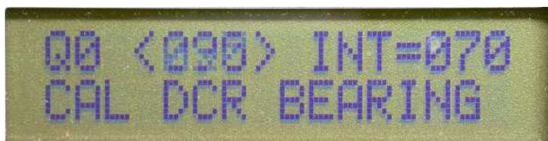
Figure 4 : Menu 5 pour faire tourner le zéro à gauche

Décrémentation de 1 degré à chaque appui sur le BP. Attention, c’est assez lent. « DCR » est l’abréviation de « Decrease », pour décroître.