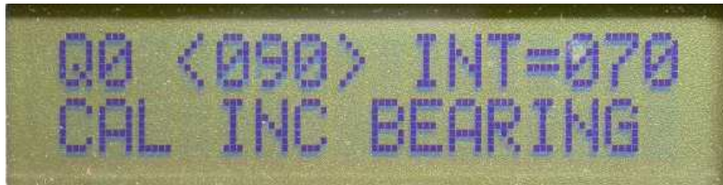
Figure 5 : Menu 6 pour faire tourner le zéro à droite

Par exemple si vous utilisez le Doppler Montréal en fixe, les menus manuels 5 et 6 permettent de caler l'axe du Doppler sur le Nord par rapport à une source connue.