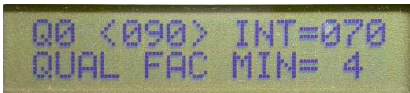
Figure 6 : Menu 7, réglage de Qs le seuil de mesure

En recherche de signaux courts ou impulsionnels, comme les signaux des balises 406, c'est un réglage très important. Dès que le signal va être correct, Q va passer à une valeur plus élevée ( Q > Q_s ) ce qui va déclencher la mesure de direction et son affichage. Dès que le signal va disparaître, Q va devenir très faible ( Q < Q_s ), et l'affichage va être gelé dans la dernière bonne direction mesurée : c'est la mise en mémoire.