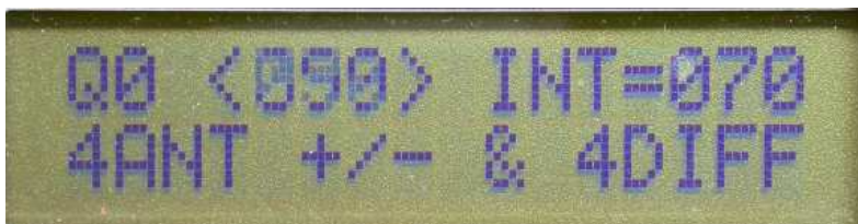
Figure 8 : Menu 14 pour s'adapter au type d'antennes

-- soit pour piloter un système de 4 antennes par des créneaux positifs, négatifs, ou en différentiel, il faut alors utiliser la position « 4ANT +/- & DIFF ». Le choix final est effectué par la position des prises de connexion sur les 8 sorties internes ; 4 sortent des créneaux positifs et les 4 autres sortent des créneaux négatifs.