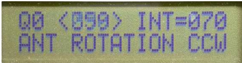
Figure 7 : Menu 13 pour changer le sens de rotation

Après étalonnage de l'axe, il faut vérifier et inverser éventuellement le sens de rotation. On peut faire tourner les 4 brins dans le sens horaire ( CW en anglais pour « clockwise ») ou anti-horaire ( CCW pour « counterclockwise »).