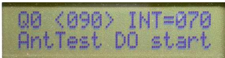
Figure 9 : Menu 15 qui permet de tester les antennes individuellement