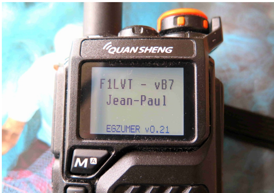
Photo 1 : Le TX QUANSHENG UV-K5 avec la version EGZUMER du firmware. On voit apparaître la mention « EGZUMER v0.21 » en bas de l'écran d'accueil.

Le QUANSHENG UV-K5 est un TX ouvert, facilement reconfigurable. Plusieurs sources fournissent des versions différentes du logiciel interne, permettant d'ajouter des fonctions ou de modifier le fonctionnement. Après avoir testé plusieurs de ces logiciels internes, celui qui semble apporter le plus d'intérêt est celui d'Egzumer. Nous avons testé en particulier la version v0.21, qui a été mise en ligne le 19 décembre 2023.